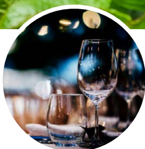
Eten en drinken