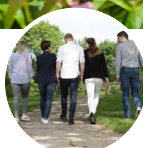
Beleven en Ontdekken

In een sfeer van rust en natuurlijke schoonheid ligt het unieke Hof van Coolhem in het landelijke Puurs-Sint-Amands.